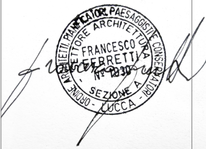
arch. Ferretti Francesco